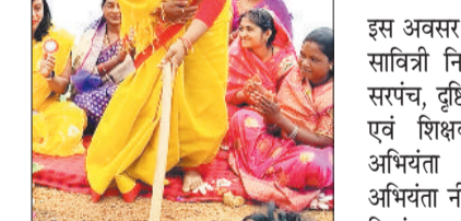
का भूमिपूजन भी किया गया। यह विद्यालय दिव्यांग बच्चों के उच्चतर भविष्य की मजबूत नींव का पत्थर साबित होगा।