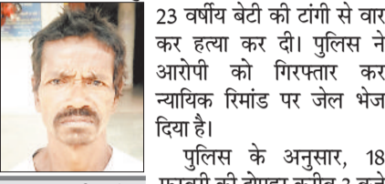
घर निर्माण को लेकर हुआ था विवाद

जिले के नारायणपुर थाना क्षेत्र के ग्राम जामटोली में रिशतों को झकझोर देने वाली वारदात सामने आई है। घर निर्माण को लेकर हुए विवाद में एक पिता ने अपनी ही 23 वर्षीय बेटी की टांगी से वार कर हत्या कर दी। पुलिस ने आरोपी को गिरफ्तार कर न्यायिक रिमांड पर जेल भेज दिया है।