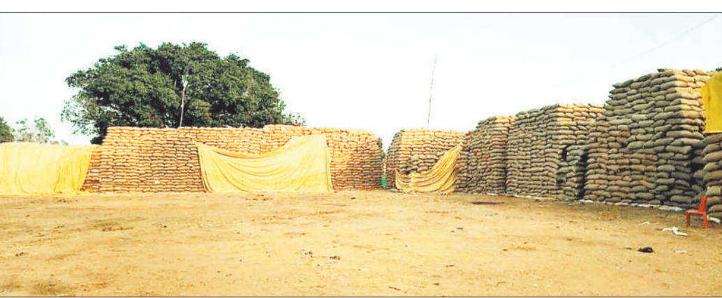
उपार्जन केंद्र में जाम धान।

धान खरीदी पूरी होने के बाद अब उपार्जन केंद्रों में संग्रहित धान का उठाव करना बड़ी चुनौती बन गई है। शासन की सखी के बाद विपणन संघ ने खरीदे गए 80 फीसदी धान का उठाव करने में राइस मिलरों को डीओ जारी कर दिया है लेकिन मिलर धान उठाव में रुचि नहीं ले रहे हैं। इधर संग्रहित धान के त्वरित उठाव के लिए फो-ऑपरटिव बैंक प्रबंधन लगातार विपणन संघ को पत्र लिख रहा है। इस बार प्रारंभ से ही उपार्जन केंद्रों में संग्रहित धान का उठाव अत्यंत धीमी गति से चल रहा है। धान खरीदी बंद हुए एक पखवाड़े का समय गुजर गया है लेकिन अभी भी समितियों में धान का अंबार लगा है। हालत यह है कि एकीकृत सरगुजा के विभिन्न पांच जिलों में संचालित 203 उपार्जन केंद्रों में से अभी तक एक भी केंद्र के संपूर्ण धान का उठाव नहीं हो सका है तथा 2 दर्जन से अधिक उपार्जन केंद्रों में निर्धारित क्षमता से दोगुना से भी अधिक धान खुले आसमान के नीचे पड़ा है। समिति प्रबंधकों का कहना है कि खुले आसमान के नीचे पड़े धान में लगातार सूखत की मात्रा बढ़ रही है तथा चूहे एवं आवारा मवेशी लगातार धान को नुकसान पहुंचा रहे हैं। समय पर उठाव नहीं होने के कारण खरीदे गए धान का वजन लगातार कम हो रहा है। उठाव में जितना अधिक विलम्ब होगा समितियों को उतना ही