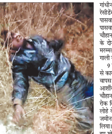
हरिभूमि न्यूज ►► अंबिकापुर

पुराने विवाद को लेकर एक युवक की बेदम पिटाई का मामला सामने आया है। आरोपियों ने युवक को धेरकर देर रात उसकी जमकर पिटाई की और जान से मारने की धमकी दी। अब इस घटना का वीडियो सोशल मीडिया में वायरल हो रहा है। इधर इस मामले में युवक की शिकायत पर पुलिस ने अपराध दर्ज कर लिया है। बताया जा रहा है कि